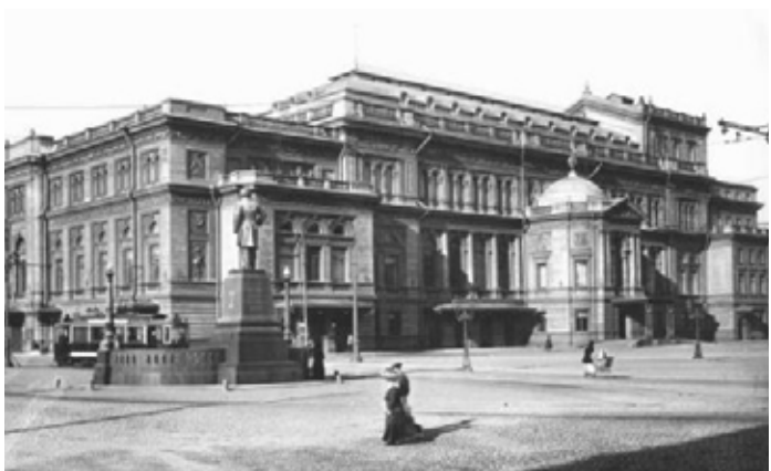
ペテルブルク音楽院

1840年 4月25日 ピョートル・イリイチ・チャイコフスキー、ロシア中部の都市ウオトキンスクに生まれる。