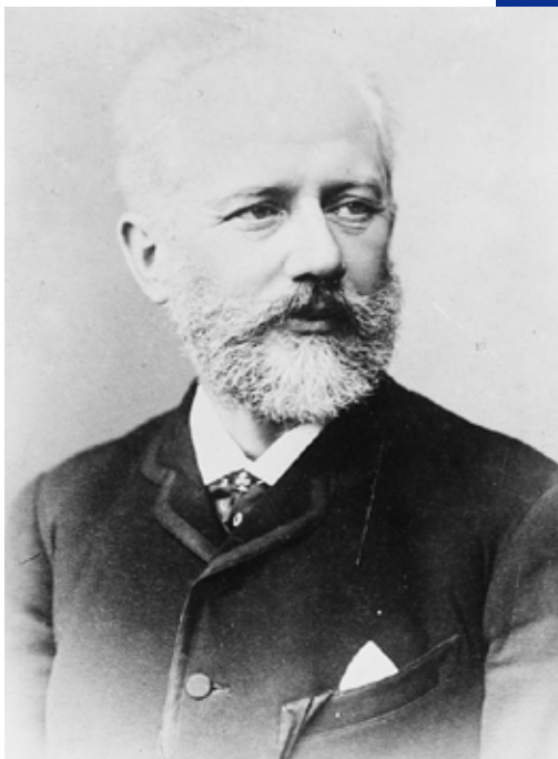
ピョートル・イリイチ・チャイコフスキー

チャイコフスキーの音楽は、交響曲をはじめとして管弦楽で演奏されるイメージが強いのですが、それは作品数にも表