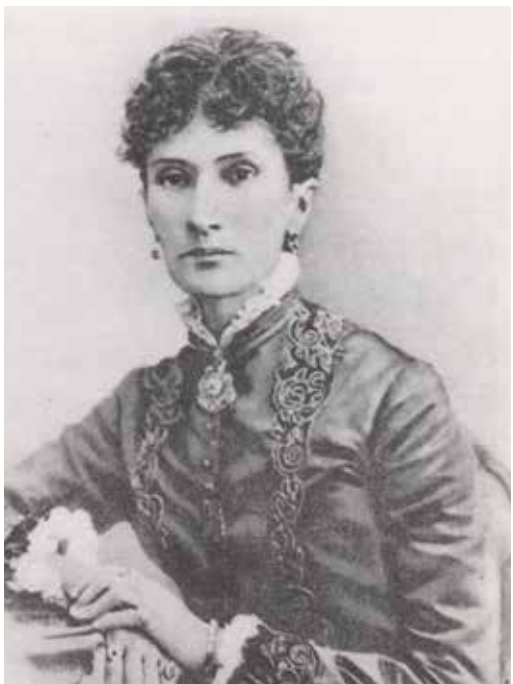
ナジェージュダ・フォン・メック夫人