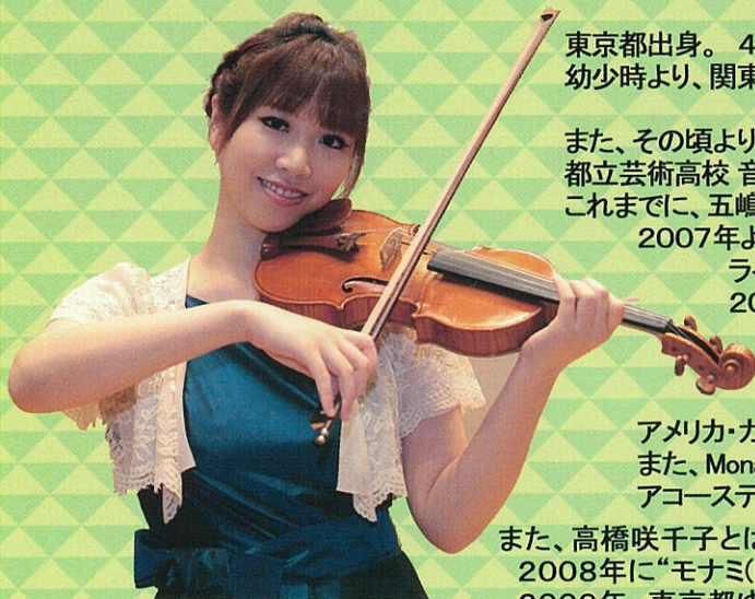
テイセナ (ヴァイオリン)